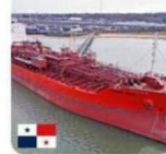
TRANS SEA Tanker / Small