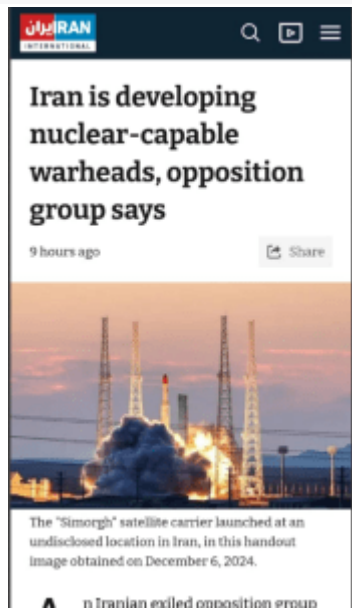
The "Simorgh" satellite carrier launched at an undisclosed location in Iran, in this handout image obtained on December 6, 2024.

Kryen teste nëntokësore në zonat e shkretëtirës së Semnanit