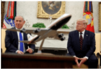
U.S. President Donald Trump listens during a meeting with Israel's Prime Minister Benjamin Netanyahu in the Oval Office at the White House in Washington, U.S., September 15, 2020.

Pasi ja prezantuan keto fakte të rreme: “Më 8 maj, Trump u tërhoq nga JCPOA (marreveshja nukleare)... ata e kishin bindur Trumpin se Irani ishte në prag të kolapsit dhe se një dalje e papritur nga JCPOA do të ishte gozha e fundit në arkivolin e Iranit. Në fazën e dytë, dokumentet e supozuara të paraqitura nga Netanyahu ndihmuan SHBA-në të fitonte mbështetje globale për tërheqjen e saj nga JCPOA. Të dyja pikat pasqyrojnë gjykimet e gabuara të këshilltarëve të Trump, jo të vetë Trumpit.”